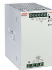
Comutarea surselor de alimentare PSL3