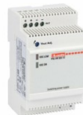
Surse de alimentare cu comutare modulare PSL1M