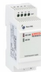
Surse de alimentare cu comutare modulare PSL1M