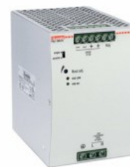
Comutarea surselor de alimentare PSL1