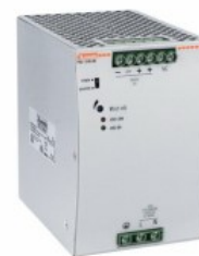
Comutarea surselor de alimentare PSL1