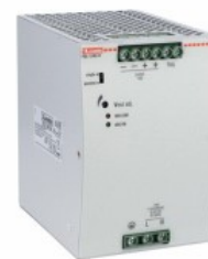
Comutarea surselor de alimentare PSL1