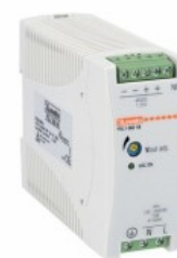
Comutarea surselor de alimentare PSL1