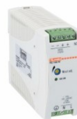
Comutarea surselor de alimentare PSL1