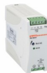
Comutarea surselor de alimentare PSL1