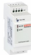
Alimentatori switching modulari PSL1M