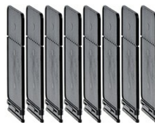
Bariera de fază GLX9

Denumirea produsului Denumirea tipului de produs