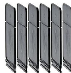
Bariera de fază GLX9

Denumirea produsului Denumirea tipului de produs