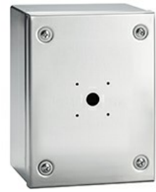
Carcase goale din oțel inoxidabil GAZS