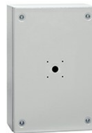
Carcase metalice goale GAZM