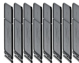
Separatory faz GLX9