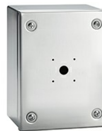
Puste obudowy, ze stali nierdzewnej GAZS