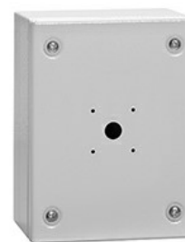
Puste obudowy, metalowe GAZM