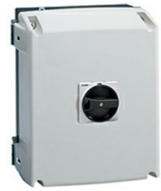
Puste obudowy, z tworzywa sztucznego GAZ