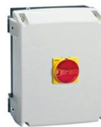
Puste obudowy, z tworzywa sztucznego GAZ