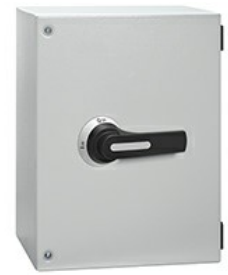
Commutatore a camme in cassetta GLZM