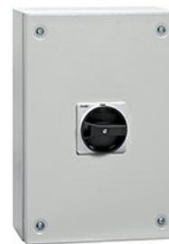
Interruttori sezionatori in contenitore GAZM