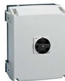
Interruttori sezionatori in contenitore GAZ