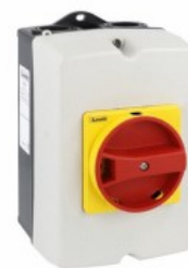
Interruttori sezionatori in contenitore GAZ