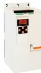
Soft starter ADXT Trifazat asincron

Denumirea produsului Denumirea tipului de produs Tip motor