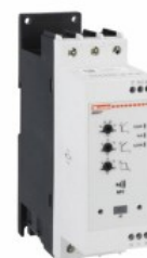
Soft starter - versiune avansată ADXNP Trifazat asincron