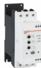
Soft starter - versiune avansată ADXNP Trifazat asincron