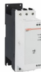
Soft starter NFC ADXNF Trifazat asincron

Denumirea produsului Denumirea tipului de produs Tip motor