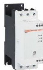
Soft starter NFC ADXNF Trifazat asincron

Denumirea produsului Denumirea tipului de produs Tip motor