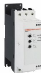
Soft starter - versiune de bază ADXNB Trifazat asincron