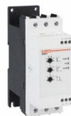
Soft starter - versiune de bază ADXNB Trifazat asincron