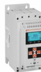
Soft starter ADXL Trifazat asincron

Denumirea produsului Denumirea tipului de produs Tip motor