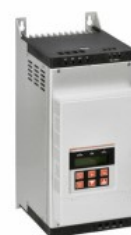
Soft starter ADX...B Trifazat asincron

Denumirea produsului Denumirea tipului de produs Tip motor