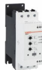
Softstart - wersja zaawansowana ADXNP Asynchroniczny trójfazowy