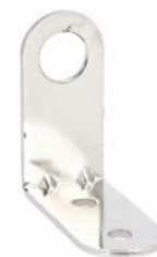
Coloane luminoase Ø50 mm LTN50