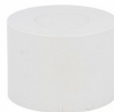
Kolumna sygnalizacyjna Ø70mm/2,75" LTN70