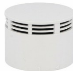
Kolumna sygnalizacyjna Ø70mm/2,75" LTN70