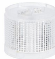
Kolumna sygnalizacyjna Ø70mm/2,75" LTN70