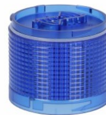
Kolumna sygnalizacyjna Ø70mm/2,75" LTN70