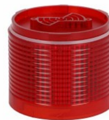
Kolumna sygnalizacyjna Ø70mm/2,75" LTN70