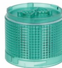
Kolumna sygnalizacyjna Ø70mm/2,75" LTN70