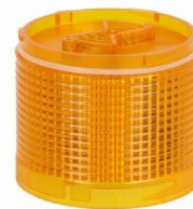
Kolumna sygnalizacyjna Ø70mm/2,75" LTN70