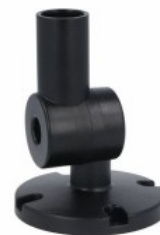
Kolumna sygnalizacyjna Ø70mm/2,75" LTN70