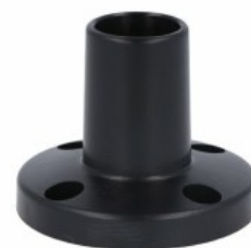
Kolumna sygnalizacyjna Ø70mm/2,75" LTN70