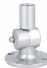
Kolumna sygnalizacyjna Ø70mm/2,75" LTN70