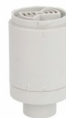
Kolumna sygnalizacyjna Ø50mm/1,97" LTN50