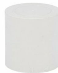
Kolumna sygnalizacyjna Ø50mm/1,97" LTN50