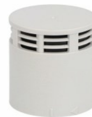
Kolumna sygnalizacyjna Ø50mm/1,97" LTN50