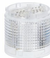
Kolumna sygnalizacyjna Ø50mm/1,97" LTN50