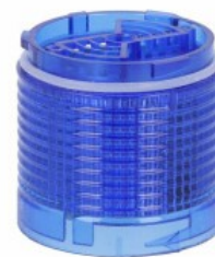
Kolumna sygnalizacyjna Ø50mm/1,97" LTN50