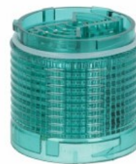
Kolumna sygnalizacyjna Ø50mm/1,97" LTN50